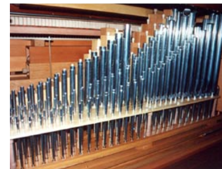
Flöte 4', Principal 2' und Quinte 1 1/3' in Metall

oder g'''". Optional lieferbar sind eine Transponiervorrichtung (voll ausgebaut), geteilte Schleifen, ein separater Winderzeuger (bessere Schalldämmung, z. B. für Aufnahmen) und geschnitzte Schleierbretter. Andere Holzarten auf Anfrage.