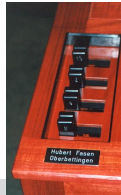
Registerschieber der geteilten Schleifen

Das Instrument ist lieferbar mit 2 bis 5 Registern; der Tonumfang beträgt C bis f'''