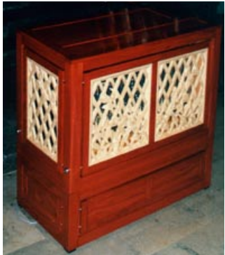
Truhenorgel mit 4 Registern und geteilten Schleifen, Gehäuse Amaranth, Schnitzwerk Linde

Falls Sie sich für eines unserer Instrumente interessieren, erarbeiten wir gerne ein maßgeschneidertes Angebot. Sie können unsere Truhenorgeln auch für Veranstaltungen mieten und sich so selbst ein Bild von ihren vielseitigen Qualitäten machen.