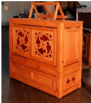
Truhenorgel mit 3 Registern, Gehäuse aus Eiche

Falls Sie sich für eines unserer Instrumente interessieren, erarbeiten wir gerne ein maßgeschneidertes Angebot. Sie können unsere Truhenorgeln auch für Veranstaltungen mieten und sich so selbst ein Bild von ihren vielseitigen Qualitäten machen.