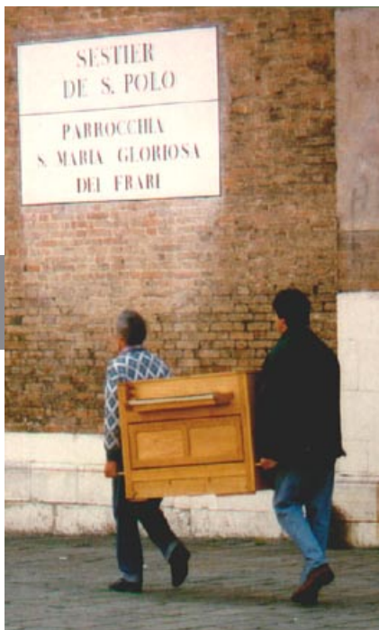
Transport des Oberteils, hier in die Frari - Kirche in Venedig

Es gibt kein "Standardmodell" von der Stange; die Disposition, die äußere Gestaltung und die Intonation werden im Gespräch mit dem Kunden erarbeitet.