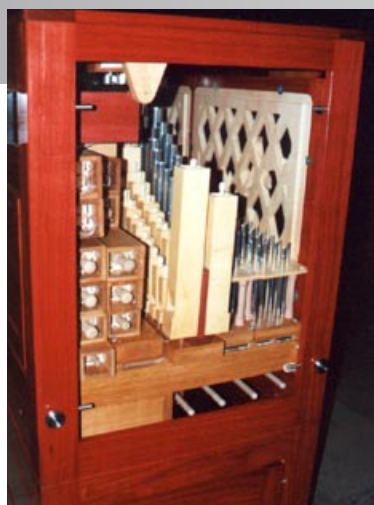
alle Gehäusedeckel können zum Stimmen leicht ausgehängt werden

Die Windanlage und die größten Pfeifen befinden sich im Unterteil; das Obergehäuse wird einfach aufgesetzt. Auch ist unsere Truhengorgel für den flexiblen Einsatz mit Transportrollen ausgestattet.